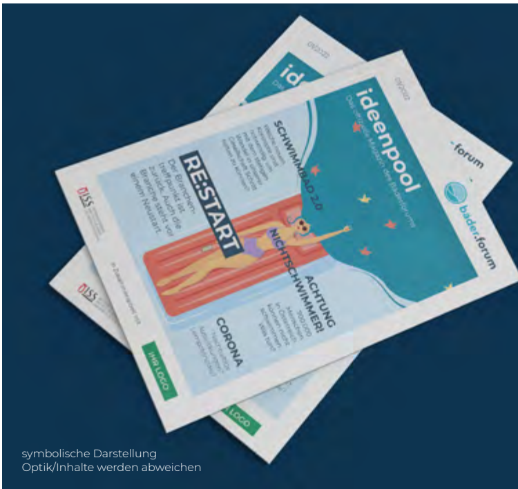
symbolische Darstellung Optik/Inhalte werden abweichen