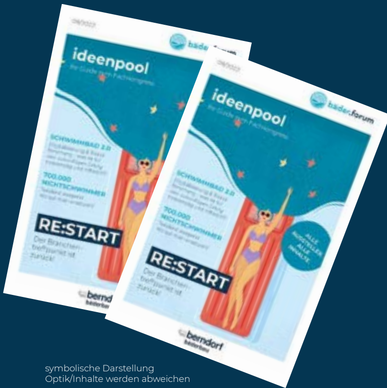
symbolische Darstellung Optik/Inhalte werden abweichen