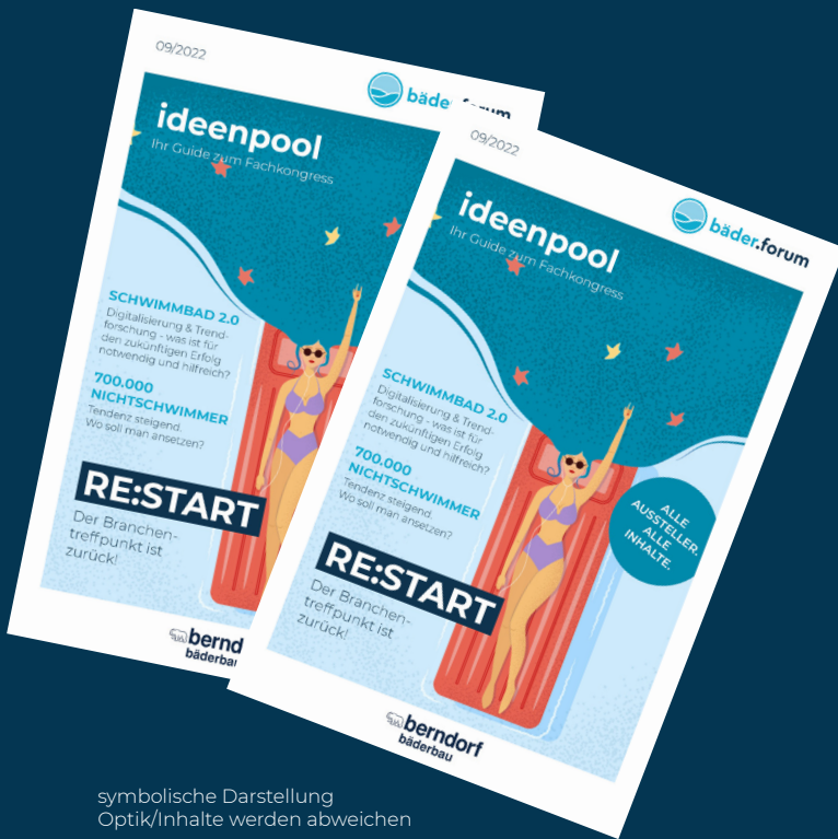
symbolische Darstellung Optik/Inhalte werden abweichen